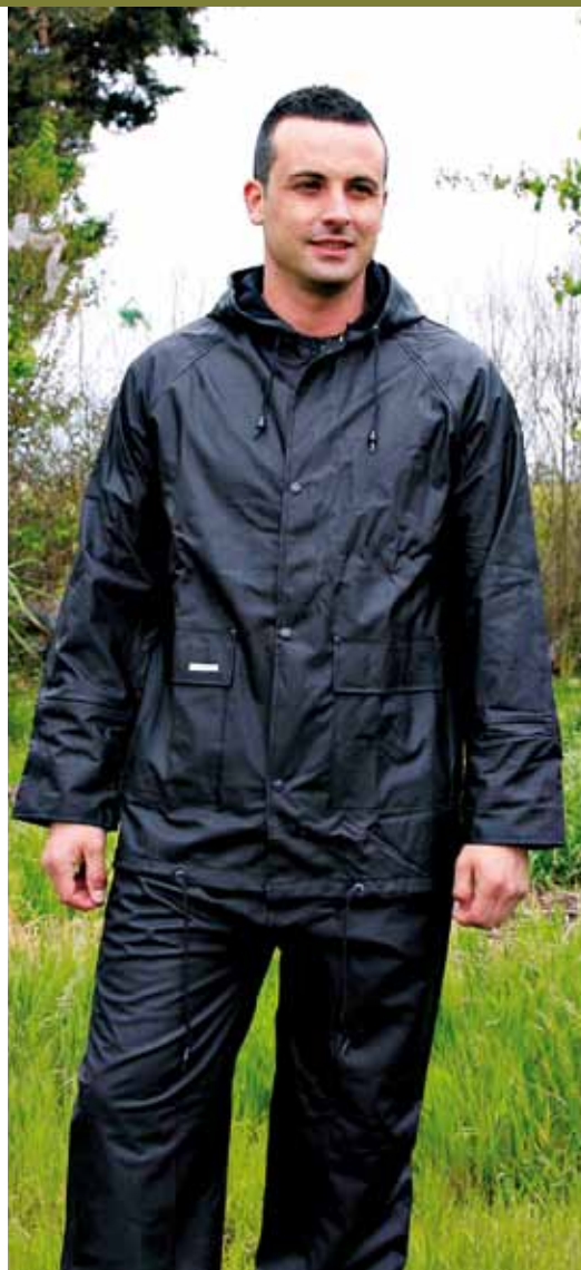
DANUBIO 804 AZUL