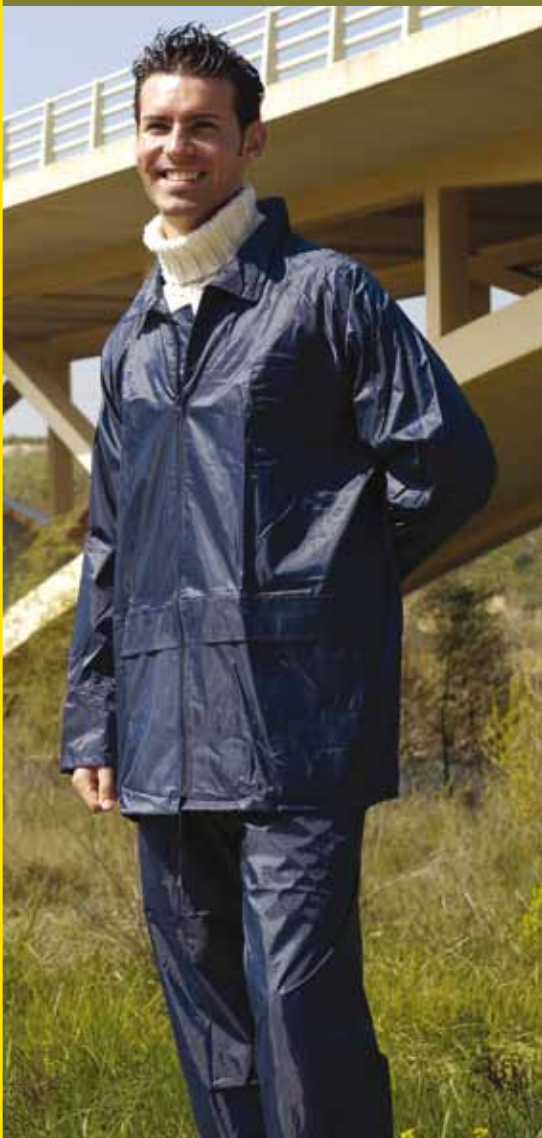
IGUAZÚ 802 MARINO