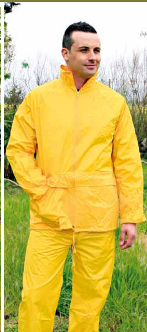
IGUAZÚ 802 AMARILLO