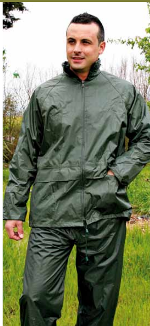
IGUAZÚ 802 VERDE