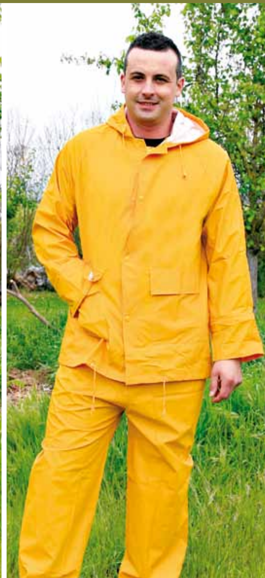
DANUBIO 804 AMARILLO