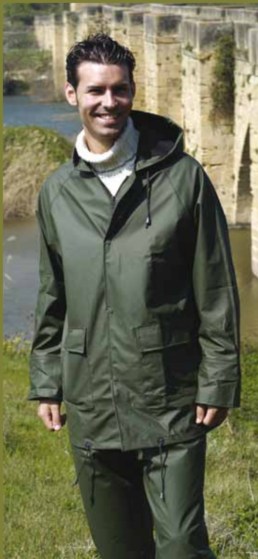
DANUBIO 804 VERDE